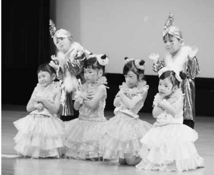
10/13(土) 大間小学校発表会