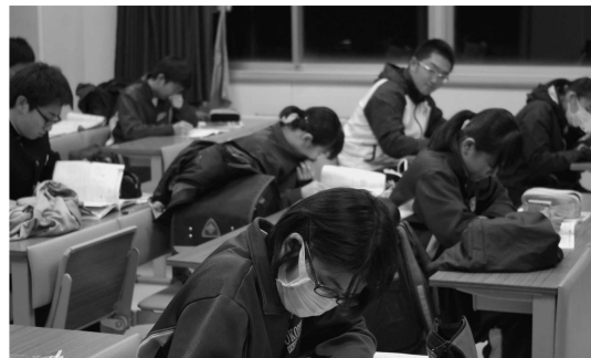
自学自習に取り組む奥中生