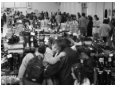
▶ 満員御礼状態の会場