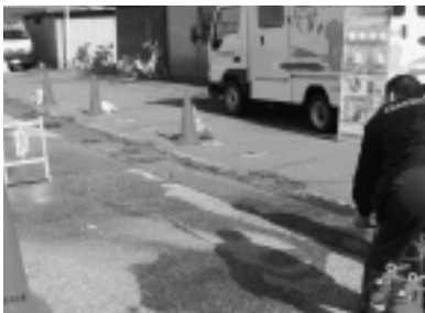
▶ 普段は触ることのない消火 器の体験コーナー