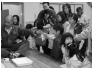
▶ 無料で配られた「ボン菓子」

11月3日・4日大間町総合開発センターにおい て、「第15回大間町産業祭」が開催されました。 会場には、ブリや昆布などの海産物から、食料 品や衣料品、玩具など多種多様な商品が特価で並 べられ、皆さんじつくりと品定めをして年に一度 の産業祭を楽しんでいました。