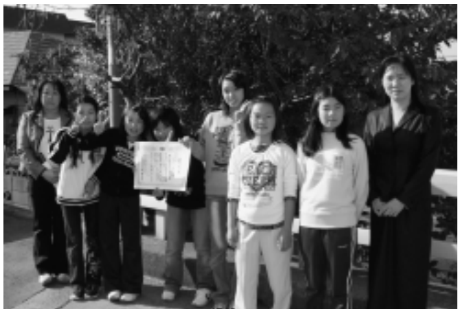
▲最優秀賞ゲットでピース