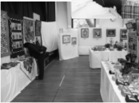
▶ 絵画や手工芸品のほか、 茶道の体験コーナーもあ りました。