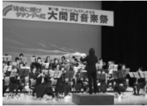
▶ 迫力のある大人数での合同演奏