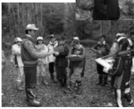
◀自然の大切さを学ぶ奥戸児童