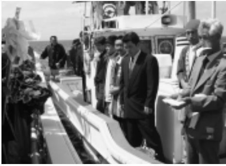
▶「御札入れ」を行う浜端組合長

その後、神楽船を先頭に10隻以上の役船が連なり、大間沖へ出航。安全と豊漁を祈願した御札を海に納め