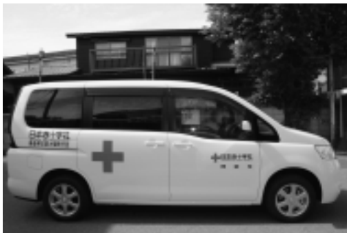
▶新しく配置された博愛号。今後、様々な場面で活躍することになります。