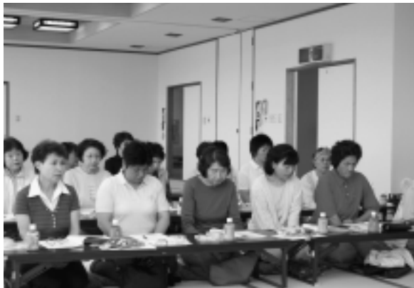
▲日々、町の健康増進のため活動しています。