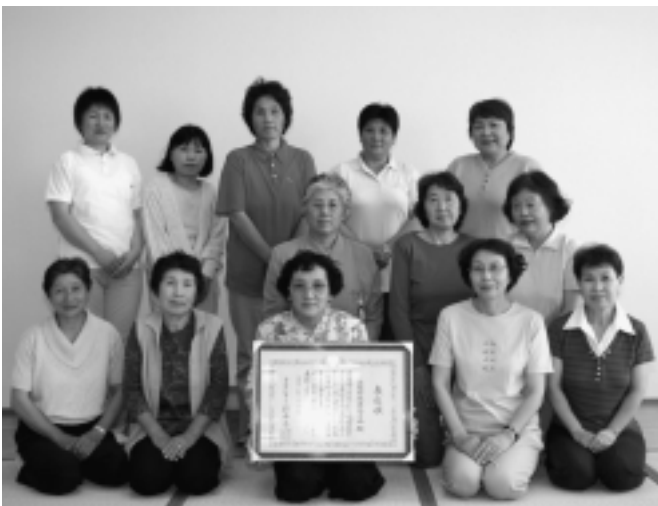
▲総会出席者で記念写真

また、総会終了後は、「青い森のメッセージ」の手話コーラスの練習や誰でも手軽にできるダンベル体操を行い、自らも健康増進に取り組みました。