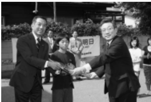
▶日本赤十字社青森県支部事務局長より鍵が手渡されました。

7月19日（木）役場前において大間町赤十字奉仕団と大間小赤十字活動児童生徒の皆さんが参列し、赤十字救援車「博愛号」配置式が行われました。今後は、平時には町の福祉事業に、災害時には被災者の移動や避難所への支援物資の輸送などに役立てられます。