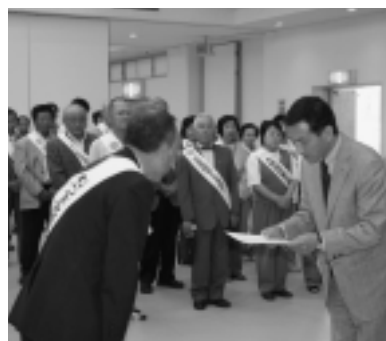
▶法務大臣からのメッセージ伝達