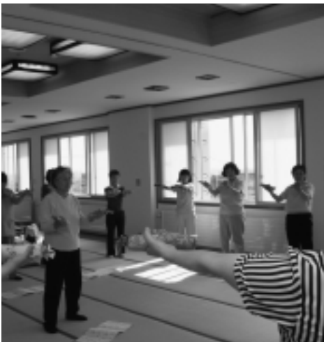
▲ダンベル体操を実践中