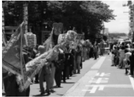
▶極彩色の天妃様行列

「御札入れ」が行われました。また、大漁祈願祭が終了すると、続いて神社前から、太神楽を先頭に台湾や東南アジアで広く信仰されている海難救助の神様「天妃様」の行列が出発。銅鑼や爆竹の音が鳴り響く中、色鮮やかな行列が町内を練り歩きました。