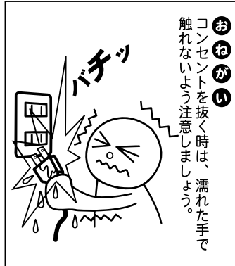
（財）東北電気保安協会

経済産業省では、毎年8月を「電気使用安全月間」と定め、電気使用安全運動が全国一斉に行われています。