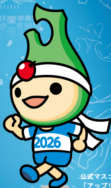
公式マスコット 「アップリート君」