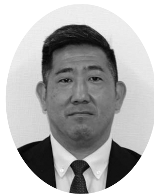
堀 祐介 議員 質問時間 60分