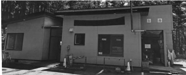
大間温泉養老センター

・指定管理について (株)グリーンストアールへ再指定したい。 ・再指定期間について 令和8年4月1日～令和13年3月31日の5年間としたい。 ・選定理由 ①令和3年度から令和7年度まで、(株)グリーンストアールが指定管理者として行った結果、管理基本方