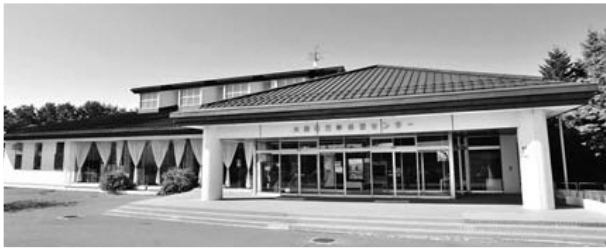
大間町海峡保養センター

令和8年3月31日をもって、5年間の指定管理が終了となることから、4月1日からの指定管理の指定予定に係る概要の説明を受けた。